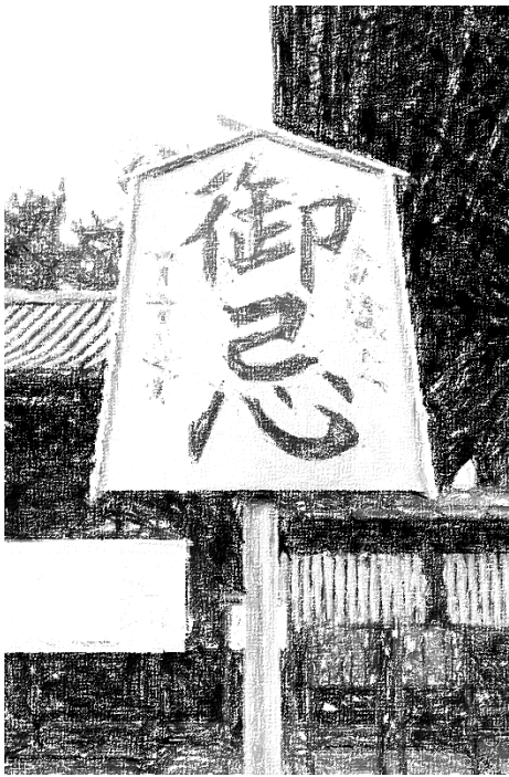
浄土宗大本山増上寺御忌 高札