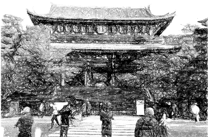
浄土宗総本山知恩院 三門