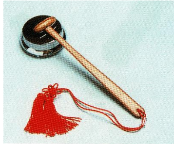
鉦 (ふせがね) と撞木 (しゅもく)