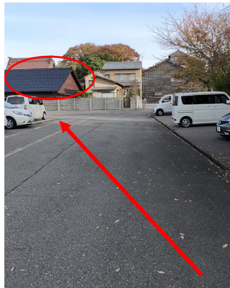
⑤左斜め前方の屋根が 弘願院です。(弘願院の裏側) 右奥の忍者寺駐車場は 絶対に駐車しないでください。