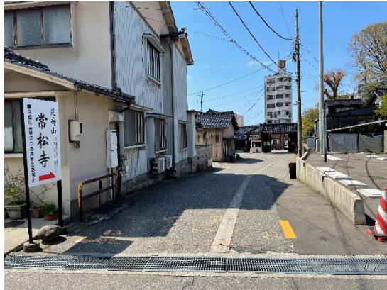
①常松寺さま入口の様子 (看板が目印です)