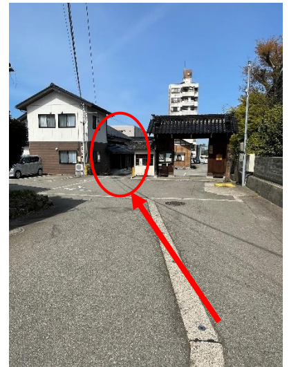
③門の左側を通る。 (下り坂になっています)