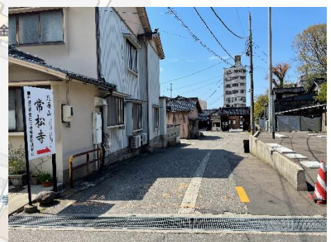
常松寺駐車場の入り口の看板