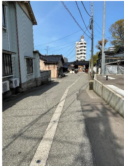
②境内は徐行運転で お願いします。