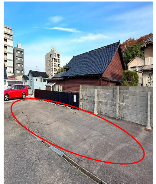
⑥第一優先箇所 A の様子。 黒いフェンス・コンクリート 壁際に駐車してください。 バックの際は要注意!!