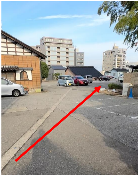
④門の左側を下りたら駐車場 右奥の方へ(弘願院側) ※出合い頭に注意!!